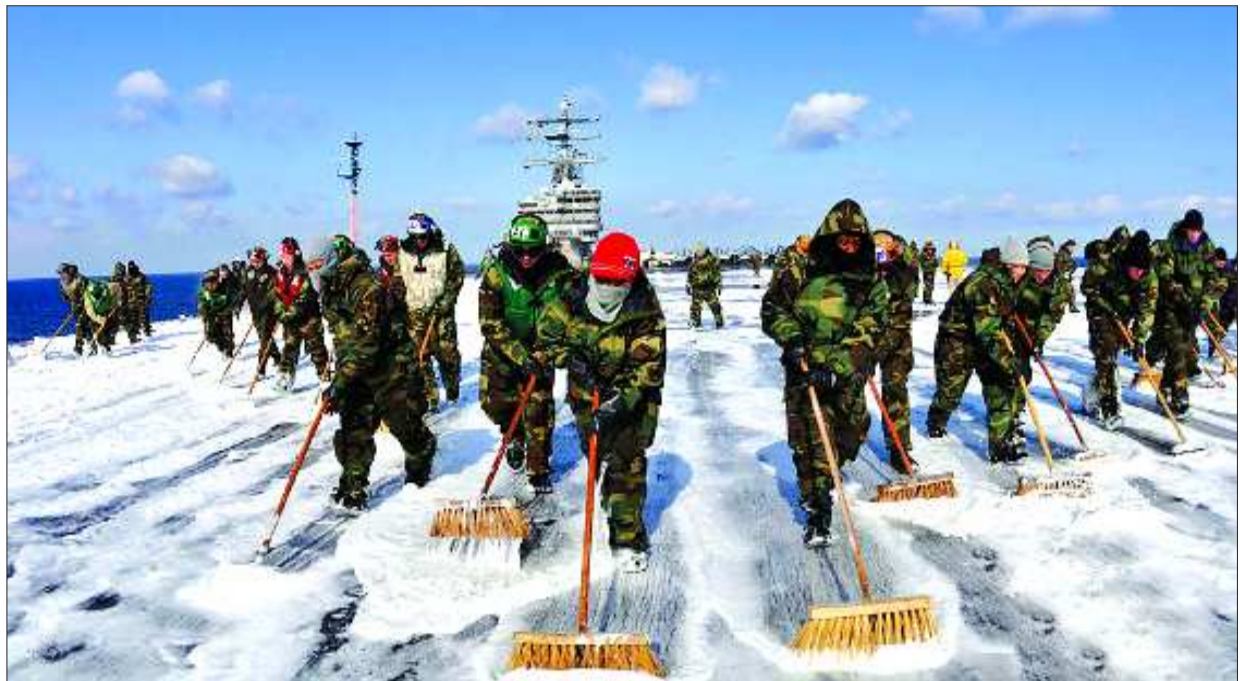
3月23日,美国士兵对参与日本地震救灾的“里根”号航母及飞机进行大清洗,以消除潜在的核辐射污染威胁。(钟欣)

宫内厅说,行宫无法接纳住宿,但是将用大巴接送灾民前来洗浴,并设置专门的医疗点和休息场所为灾民们问诊。这一项活动将从本月26日起到4月底进行。(宗禾)