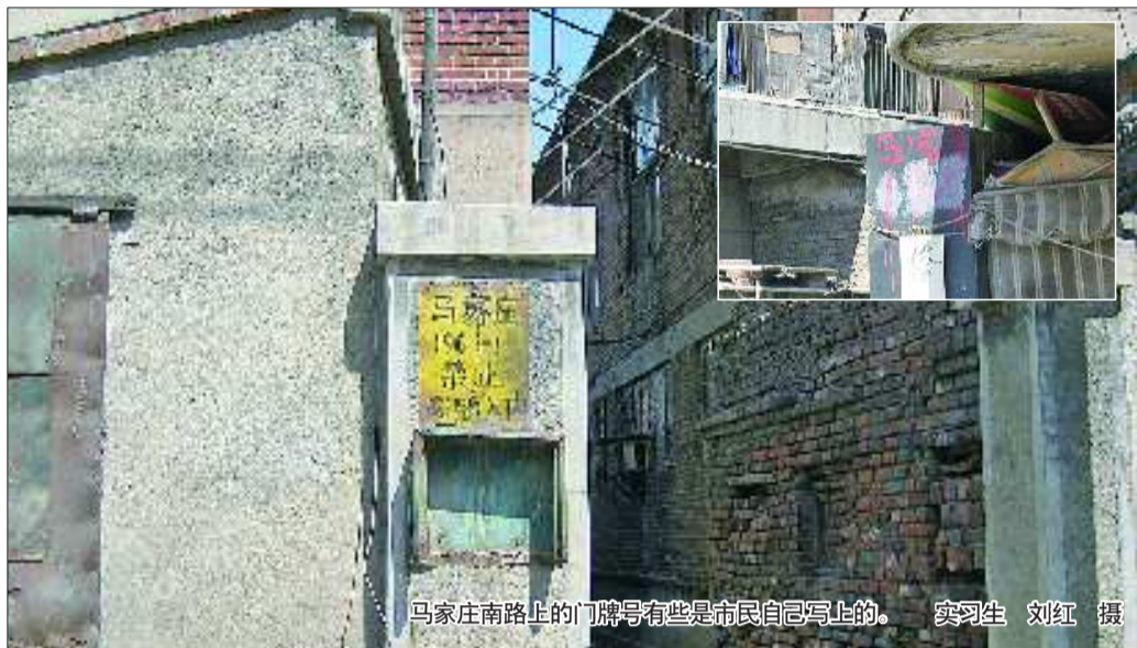
马家庄南路上的门牌号有些是市民自己写上的。

本报3月24日讯(记者 王光营 实习生 刘红)“这条路明明叫马家庄南路,为什么短短500米的距离内竟有四种门牌号?”24日,记者在马家庄南路看到,除了这个名称外,还有济泺路、马家庄、马家庄新村等多种门牌号码。有关部门表示,这种现象比较普遍,可能是多次建设导致的。