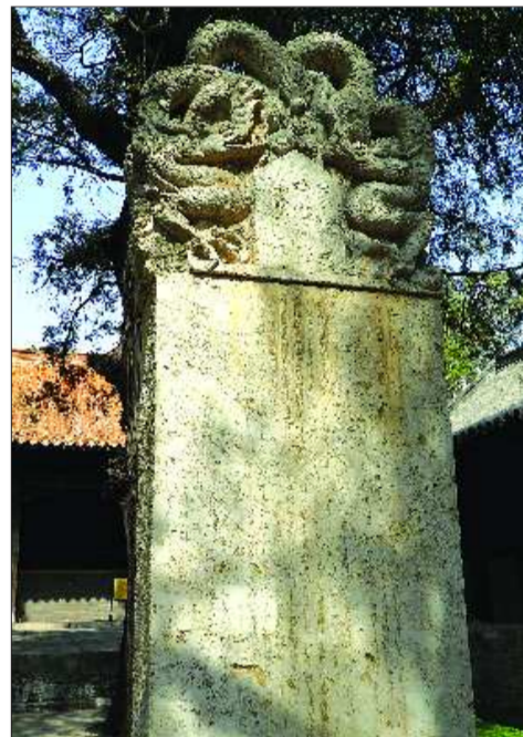
尼山孔庙内的记事碑