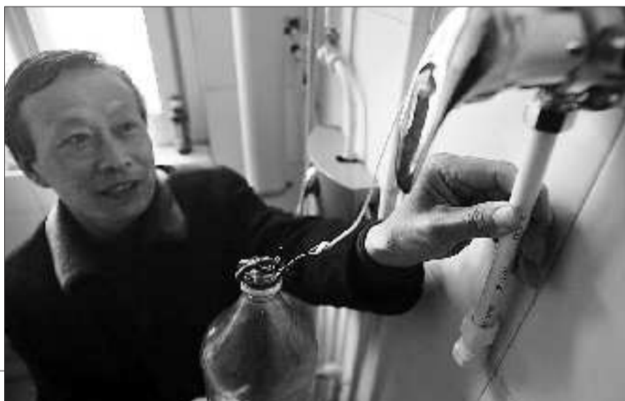
轩大爷向记者演示太阳能断水原理。