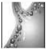
双歧杆菌快速消除胃炎炎症处的有害菌