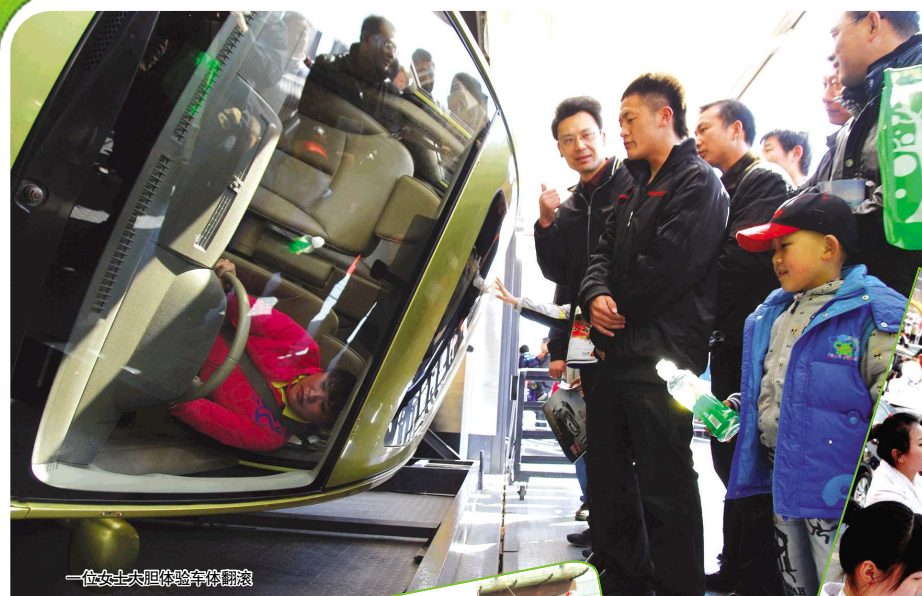
一位女士大胆体验车模翻滾