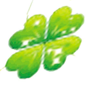
▼热闹的订车风云榜