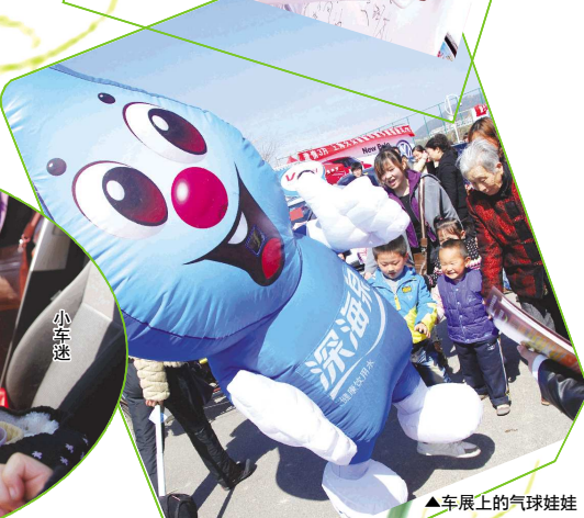
▲车展上的气球娃娃