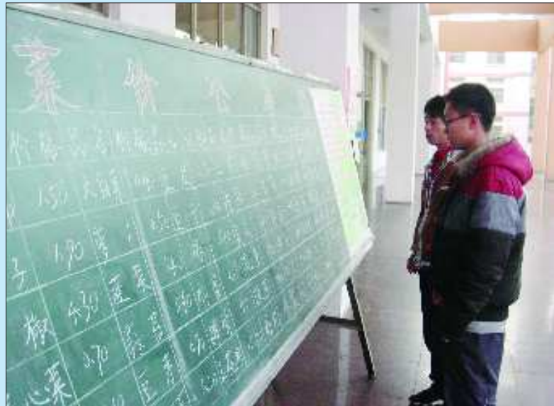
▲菜价及时向学生公示。

“别看只调5分钱,我们先后论证了两个多月,充分征求了各方面意见,之所以公布账单明细也是为了让师生有知情权。”枣庄学院饮食服务中心负责人对记者说,学生就是亲人,就是顾客,在食堂饭菜调价上,要尊重学生的“话语权”。粮油、人工费用和水电气等涨价,饭菜再不调价的确难以维持。