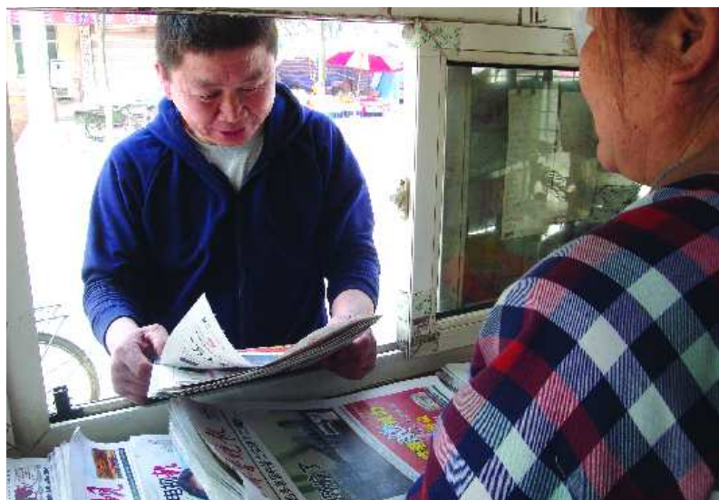
孙女士在自家报亭里

为了增加收入,孙女士和儿子决定租个报亭来经营。“报亭租的是老街坊的。老街坊由于身体不大