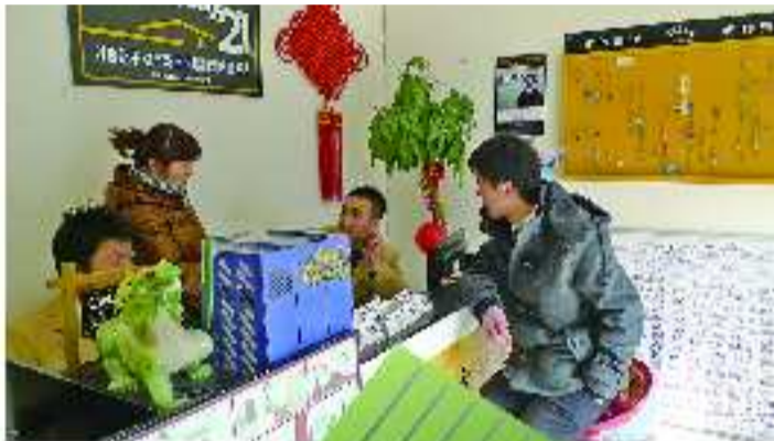
▲限购影响下,不少首次置业的年轻人开始改变置业计划,二手房交易出现终极置业的苗头。

“先买一套小户型房子临时过渡,以后有条件了,再改善换套大的。”这是不少首次购房年轻人的计划。然而,随着济南限购政策的不断深入以及“限购无期限”的信号,不少首次置业的年轻人有了自己的担忧:二手房首付比例提高至60%,购房成本加大。限购政策会不会越来越严厉?政策会不会严厉到不允许购置二套房?业内人士分析,政策影响下,不仅是开发商做出了调整计划,不少购房者也在改变置业计划,尤其是首次置业的年轻人转向一步到位的“终极置业”。