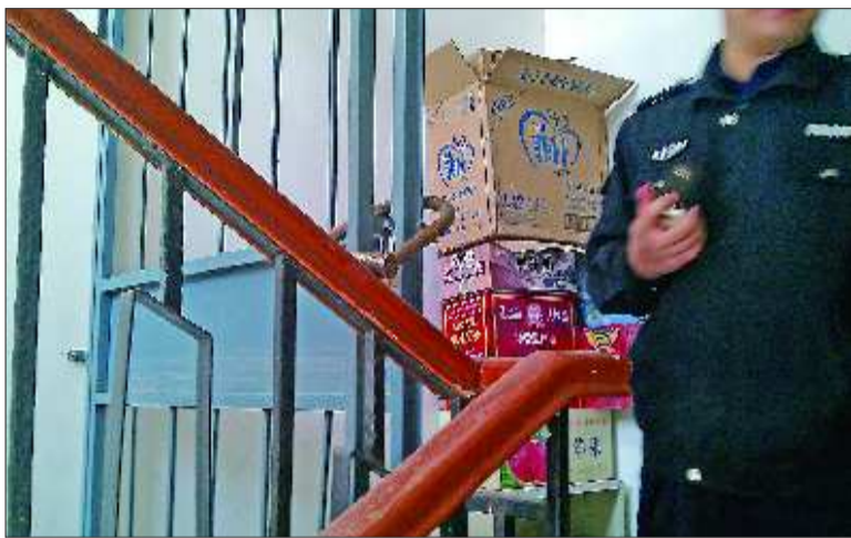
无奈,通往9层的楼梯口锁着门,城管执法人员也很

从2010年年底上海花园高层19楼开始施工至今,高层18楼以下业主先后向物业、城管、房管、消防等相关部门反映了自己遇到的问题,其间这些部门或出动进行了执法,或出面针对业主们提出的问题做出了答复和解释。但业主们表示,时至今日,他们仍然存在一些疑问需要相关部门和开发商予以澄清和解释。