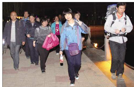
“走友”们走到一半,虽然都有些累了,但还是精神百倍。