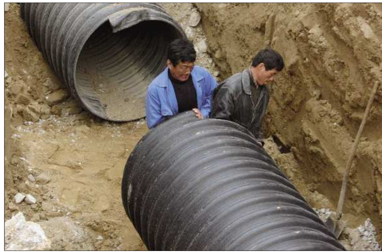
1米粗的排雨管道建成后,将大大提高排雨速度。

该工作人员说,利民西路原有一处泵站,后因运河截污导流工程给拆除了,现在铺设的管道为雨水专用排水管网,能避免污水流入运河中。“根据规划,利民路积水问题应该能得到解决。不过现在还不敢保证能彻底解决问题,毕竟还没有经受实际暴雨考验。”