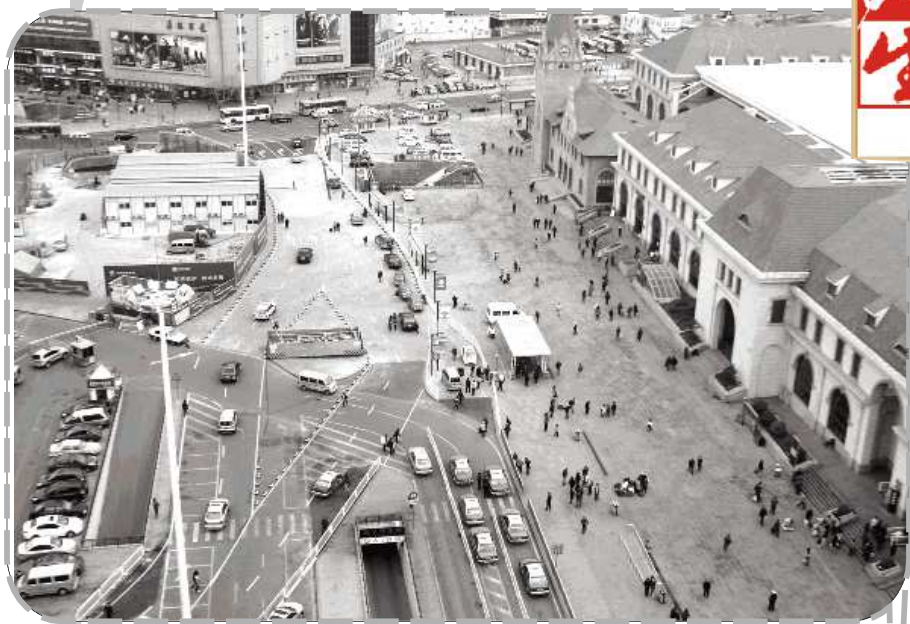
由于很多市民不知情,调流首日,火车站广场周边新开辟的调流道路上车辆稀少。

本报4月6日讯(记者 赵波) 由于很多市民并不清楚调流方案,加上公交车等大型客车拥堵,6日上午,火车站广场调流首日就遭遇了堵车。交警部门经过现场调查决定,将在7日出台新的调流方案,并设置调流提示牌。