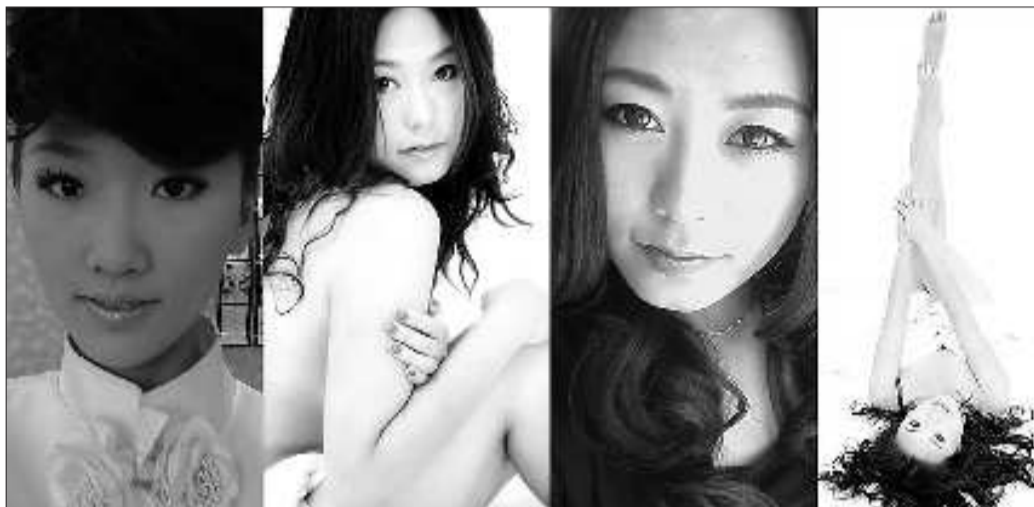
入选的部分车模。 冷炳豪 张萍 制图

本报4月6日讯(记者 张永斌 见习记者 张萍) 参观车展的市民有福啦!4月9日—4月10日, 齐鲁晚报主办, 日照三乐文化传媒有限公司、黄海网承办的首届日照春季车展将在太阳广场精彩上演。总共30位青春靓丽的车模将助阵首届日照春季车展, 在现场展现“香车美女”的魅力。