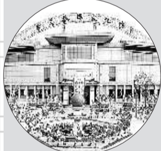
古贝春酒文化博物馆。