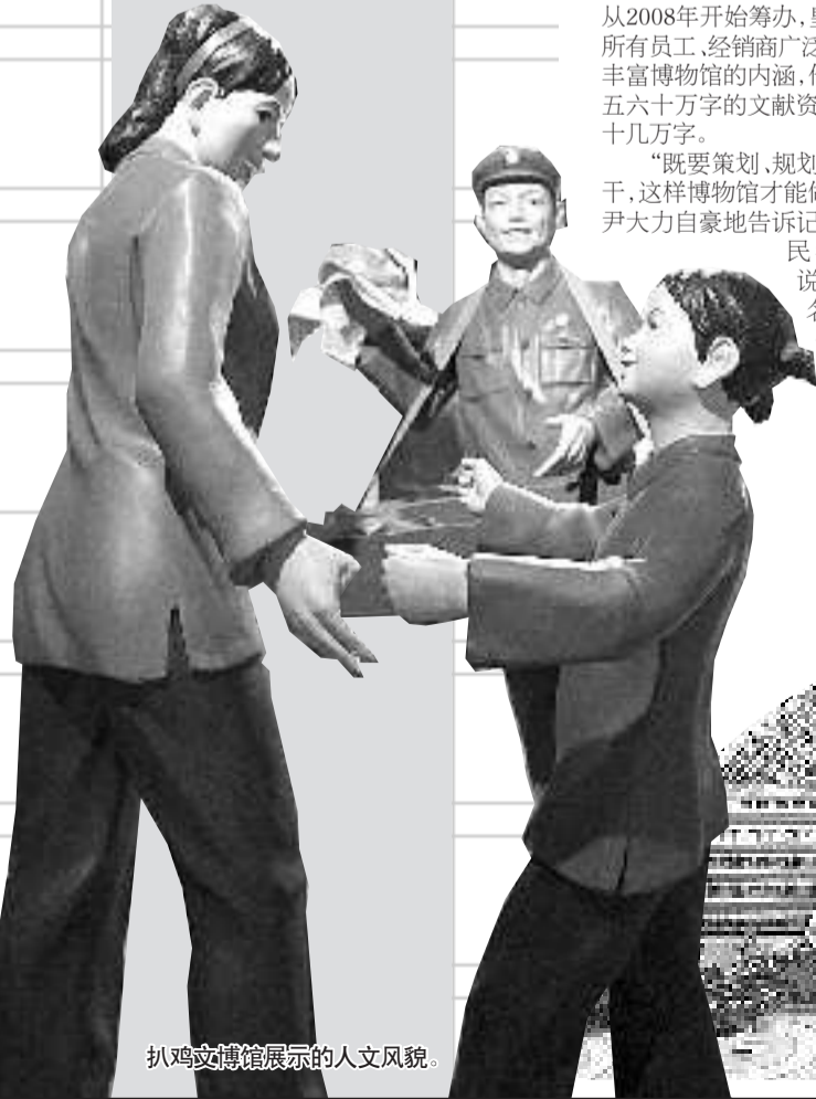
扒鸡文博馆展示的人文风貌。