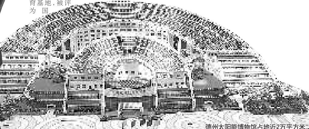
德州太阳能博物馆占地近2万平方米。