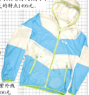
▲KOLON防紫外线超轻外衣1390元