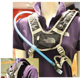
The north face水袋,容积1.5L。

好的户外产品设计一定要走在消费者的前面。就让我们来看看今季有什么新奇的户外产品出现吧。