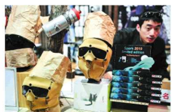
墨镜与面罩合二为一,是为了更好地保护户外环境下的面部皮肤。