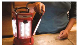
Coleman“子母式LED营灯”,采用分离式设计理念,照明时间长达75小时。