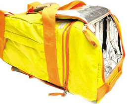
The north face新款背包,带有可拆卸保鲜袋。