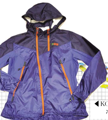
▲KOLON防风防小雨冲锋衣1430元