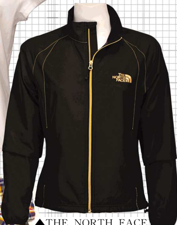
▲THE NORTH FACE防风、防水冲锋衣648元