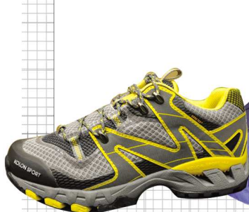
▲Kolon sport丁基橡胶鞋,抓地力很强1490元

不仅THE NORTH FACE这样的老牌向时尚设计发力,来自韩国的Kolon spoty也推出了色彩明亮、设计新颖的冲锋衣、防晒服,Columbia潮流味道十足的日系风户外系列都同样的可圈可点。