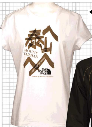
▲THE NORTH FACE速干T恤