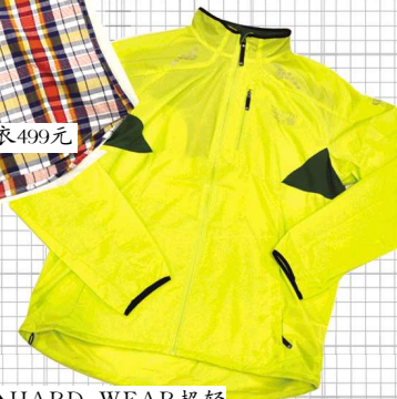
▲HARD WEAR超轻冲锋衣具有防风、防水、透气的特点1499元。