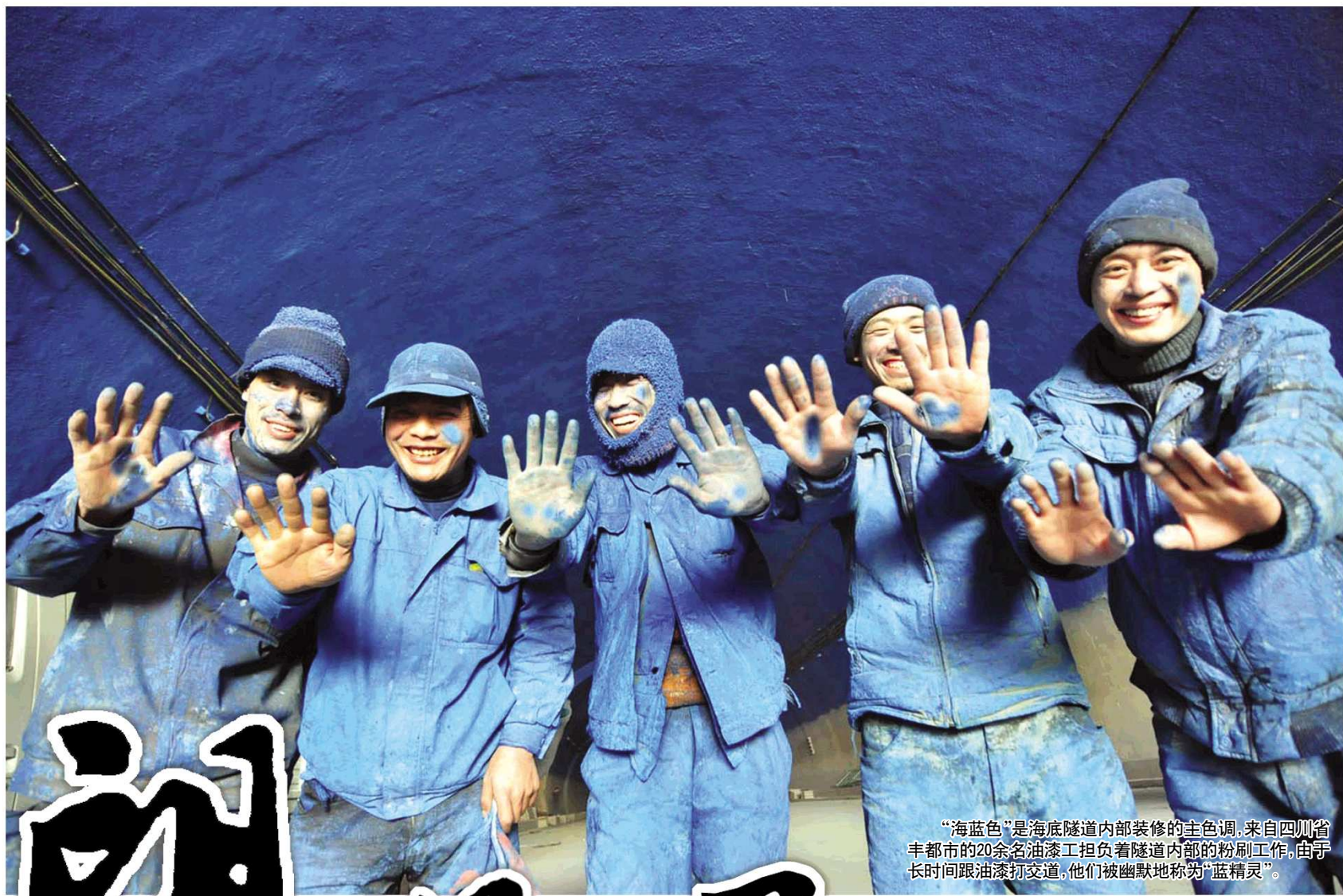
“海蓝色”是海底隧道内部装修的主色调,来自四川省丰都市的20余名油漆工担负着隧道内部的粉刷工作,由于长时间跟油漆打交道,他们被幽默地称为“蓝精灵”。