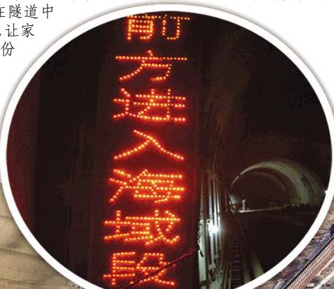
“前方进入海域段”,隧道内部安装有明显的指路牌。