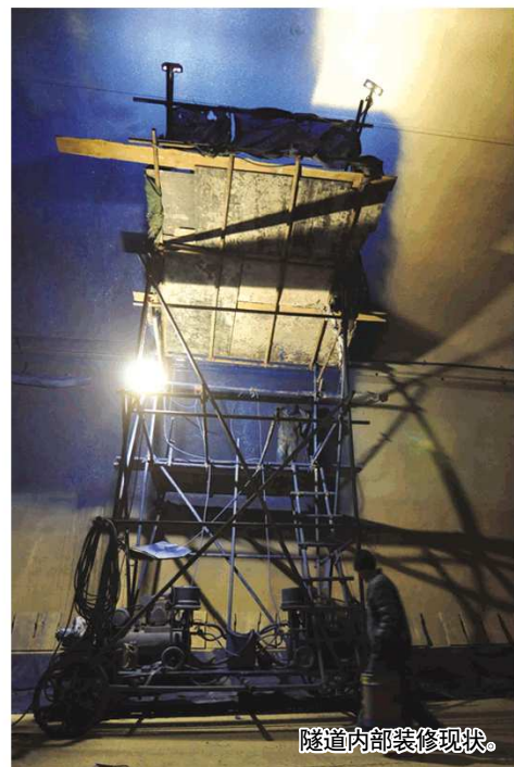
隧道内部装修现状。

正在紧锣密鼓地装修,消防系统、照明系统、供电系统、排水系统、通风系统、收费系统和信号系统等都已经基本安装完毕。目前除了接线端几条服务隧道还在进行衬砌工作外,海底隧道主隧土建施工已经全部完成。目前隧道正在进行内部装修和设施安装,黄岛端隧道内的一段阻燃沥青试验段已铺设完毕,随后将在右侧主隧道进行沥青铺设,预计上半年就能顺利实现通车。