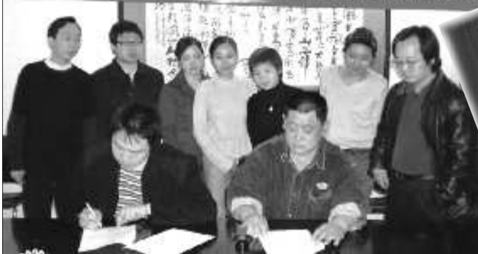
2006年12月,《中国式房奴》电视剧改编签约现场。