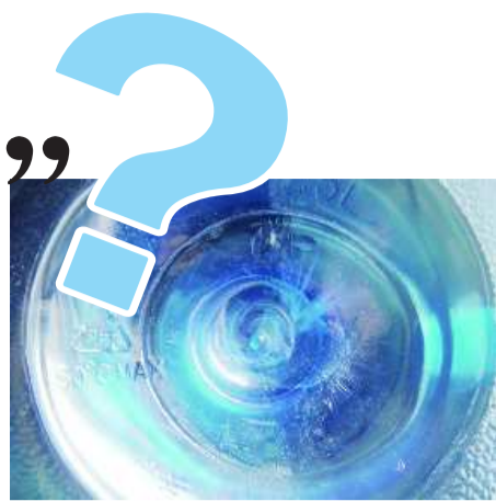
▲劣质桶底部仅有PET标识,没有生产厂商、QS认证等相关标识。

当记者问及PET桶的生产原料时,该店铺的老板说,小厂生产的大多是PET桶,一部分使用PC材料,一部分使用回收塑料垃圾制作,或者干脆全部用塑料垃圾制造,也被称为“黑桶”。