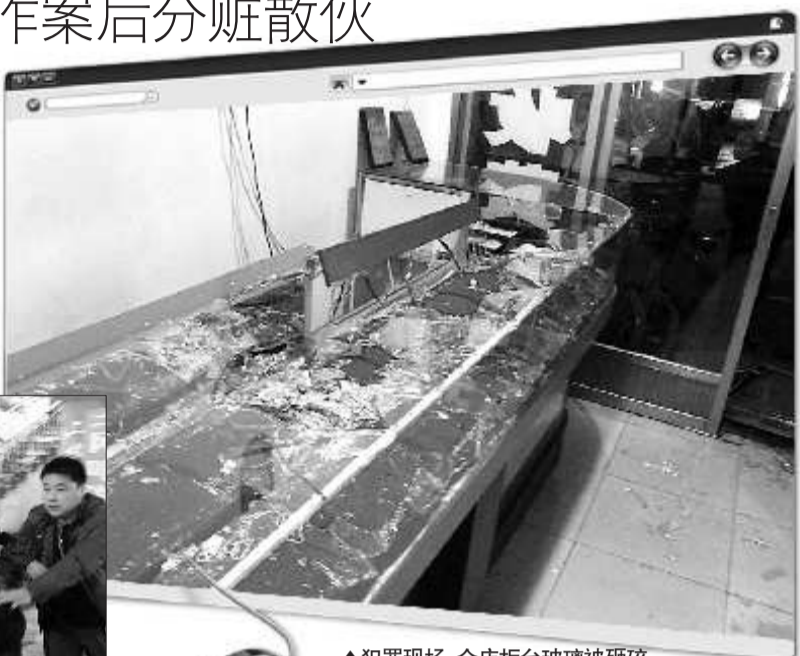
▲犯罪现场,金店柜台玻璃被砸碎。