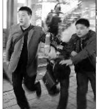
点附近的监控录像,并在附近进行调查走访。然而,这些传统侦查手段却都没有效果。

案发后,泗水警方迅速成立“3·14”重大抢劫金店专案组。按照办案经验,民警调取了案发地