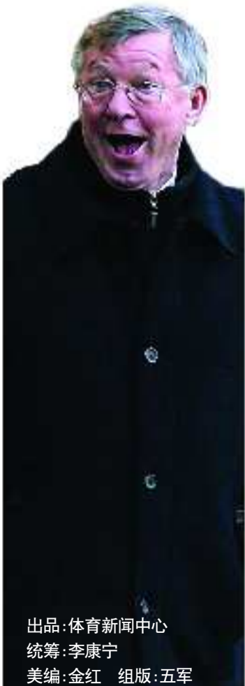
出品:体育新闻中心 统筹:李康宁 美编:金红 组版:五军

珍妮说,杰克逊是“被迫”退休的,他一直深爱着篮球,深爱着湖人队,“多少次,杰克逊在梦中惊醒,他将枕头当成篮球。”