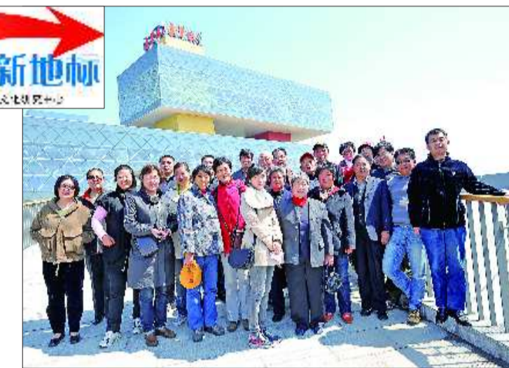
地标游成员在远望楼前合影。

雨后东营的空气格外清新。24日上午,齐鲁文化地标游一行到达黄河口生态旅游区。一路上,防洪大堤、路边的湿地,发电的风车吸引了大家的眼球。车子刚一停稳,按捺不住的地标游成员下车钻进了黄河故道天然柳林的木桥上。走在木桥上,脚下流淌着