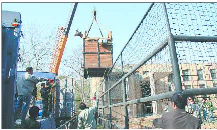
运输长颈鹿可不是个轻松活儿。

在极端情况下,有时要对动物进行麻醉才能运输,以保证动物的安全,如果采用海运或空运,情况可能还要复杂。