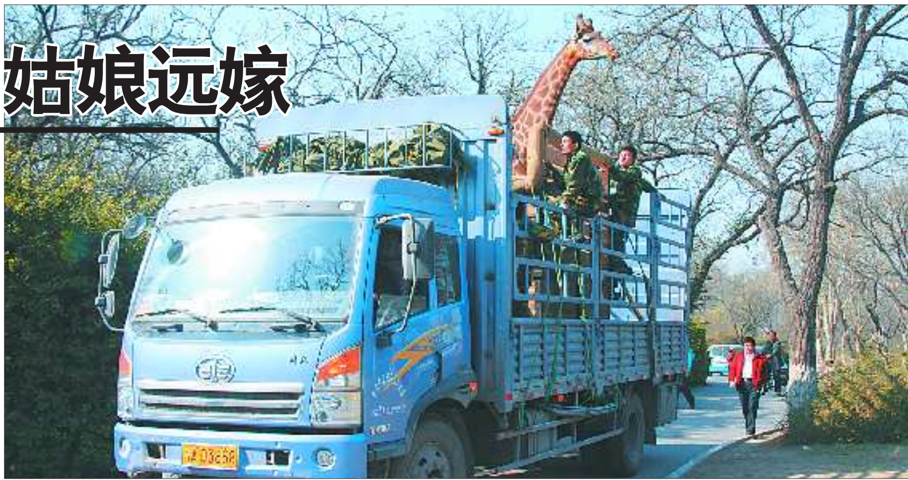
济南动物园正在转运长颈鹿。