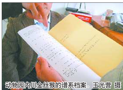
动物园内川金丝猴的谱系档案。