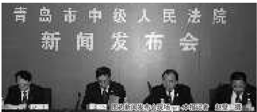
图为新闻发布会现场。