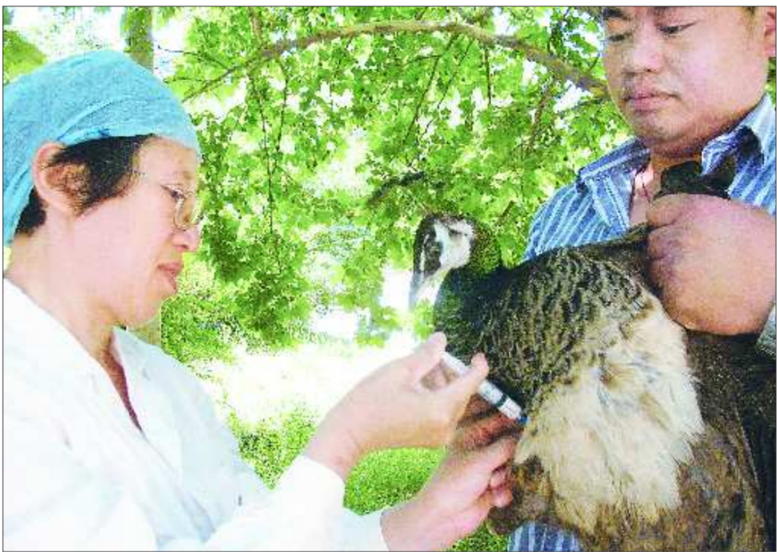
▲济南动物园兽医正在给孔雀打防疫针。王光蕾 摄

物要服用抗生素,预防肠炎、呼吸道疾病,而大猩猩、大象、长颈鹿等则要服用驱虫药,杀死蛔虫、绦虫、钩虫、蛲虫等肠道寄生虫,以防止动物出现厌食或消瘦症状。 “游客常给动物投喂食物,这样很容易惯坏动物的胃口。此外,投喂的食物可能携带了人类的病菌,很容易让动物患上肠胃炎等疾病。”这位工作人员表示,很多人害怕动物会将疾病传染给人类,其实更多时候是人类的疾病影响了动物的生存。因此,从预防疾病的角度出发,游客尽量不要投喂动物。