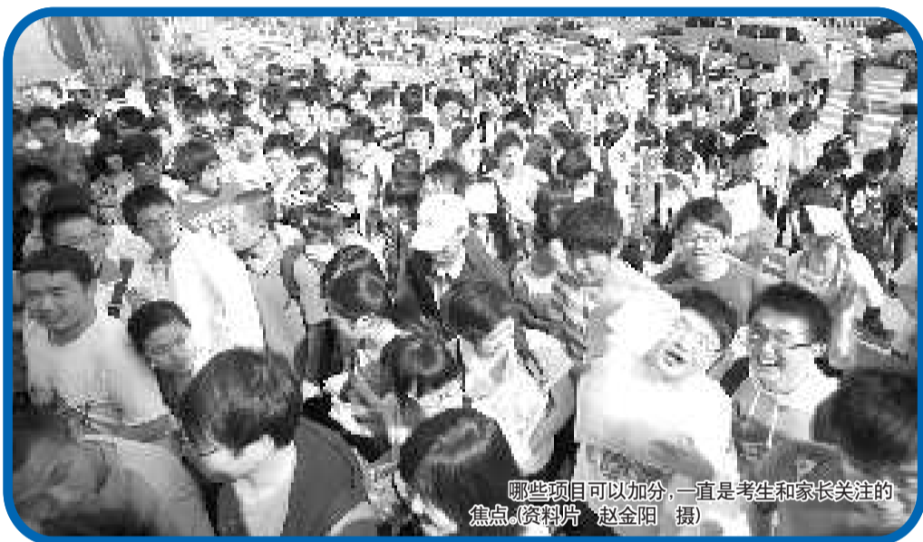
哪些项目可以加分,一直是考生和家长关注的焦点。

在莱山区出台的2011年中考招生政策中,记者发现,高中阶段招生录取加分项目有所变化。其中,音乐个人比赛、美术个人比赛、计算机等级考试、初中各学科奥林匹克竞赛将不再列入加分项目。