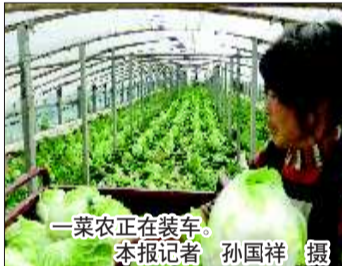
一菜农正在装车。

周显军说，接下来一毛五一斤收不到菜了。已经送出六万多斤白菜，离自己的目标还差不到四万斤，他想着尽量在明天把菜收齐，早点送完早点放心。