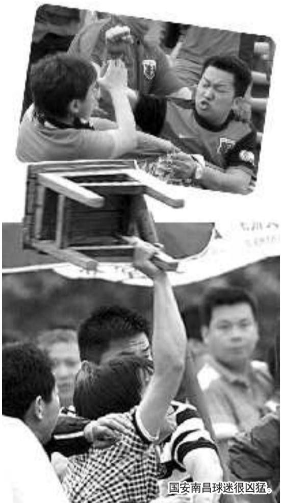
国安南昌球迷很凶猛。

马拉多纳表示,他现在的愿望是梅西不要受伤,只要按照目前的状态踢下去,梅西一定能够创造世界足坛的辉煌纪录。