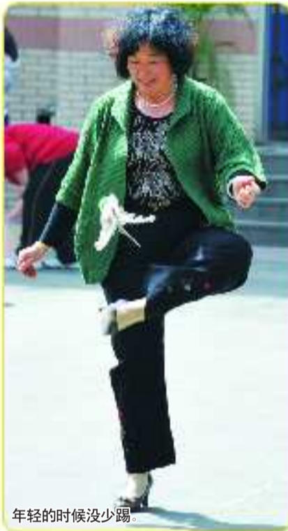
年轻的时候没少踢。