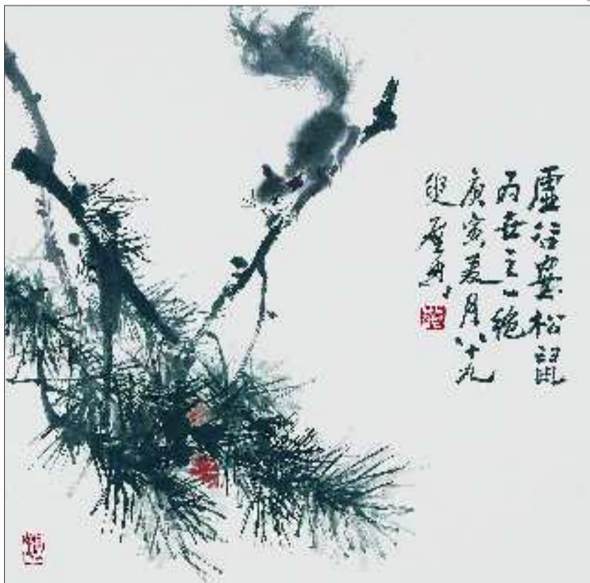
▼虚谷画松鼠 68cmx68cm 乍启典