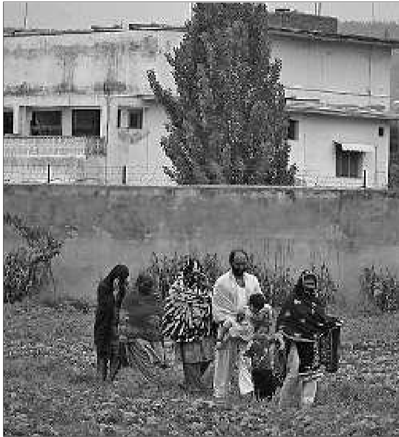
▲全家出动参观拉丹住所。