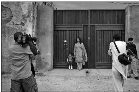
▲一些观光者在拉丹住所门口拍照留念。

尽管拉丹生前住所一直大门紧闭,但观光者们还是纷纷来到它的周围,试图看个究竟。很多人还拿出相机,兴致勃勃地拍照留念。 美国方面曾表示,为了防止这座房子成为恐怖分子们争相朝拜的“圣地”,应该尽快把它拆除。不过,当地居民称,应该把那座房子保留下来,让它成为历史的一部分。 据《中国日报》