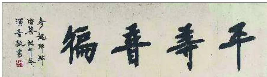
▲弘一作品“平等普遍”