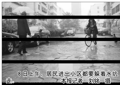
8日上午,居民进出小区都要躲着水坑走。

湖北社区一工作人员介绍,聂庄乐园小区归属湖北社区管辖,但小区内的道路设施并不在管理范围内,“具体什么部门管我也不清楚。”