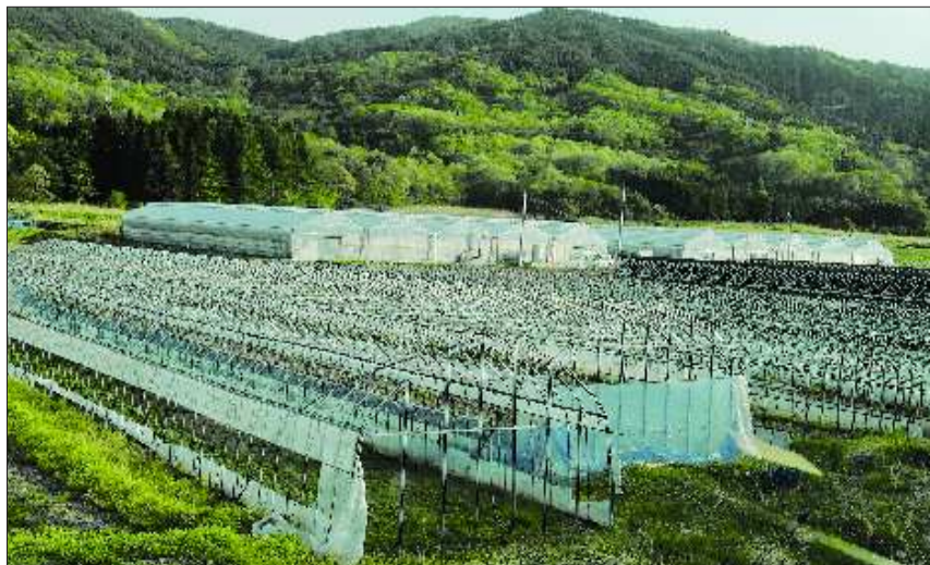
▶大棚架子下空空如也,原本应该像远山密林一样长满各种蔬菜。