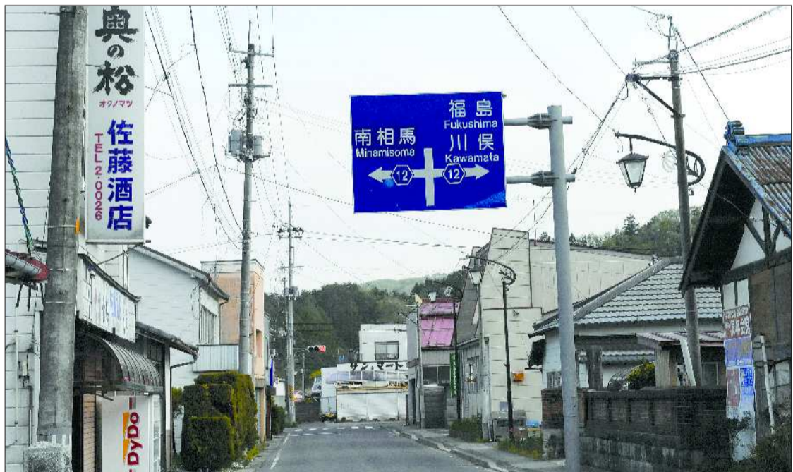
▲通往福岛、南相马(第一核电站所在地)和川俣町的路口,周围是死一般的沉寂。

只有自然的力量和漫长的时间,才能慢慢消解那些危险的核裂变元素尘埃。这个期间,智慧的人类刚好有时间好好地考虑自己到底哪里做错了。