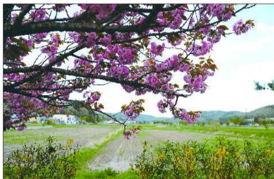
▲浪江町、川俣町交界处,大片农田被抛弃,沾染了放射性污染物的樱花默默开放。