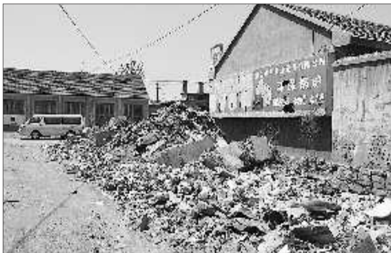
马路旁堆放的垃圾。

本报5月16日讯(记者 毛旭松 通讯员 王元强) 16日上午，市民李先生拨打本报新闻热线6610123反映，芝罘区幸福工业园路烟台绿林工具有限公司附近，不知被谁堆上了垃圾，既破坏了环境，又影响车辆通行。