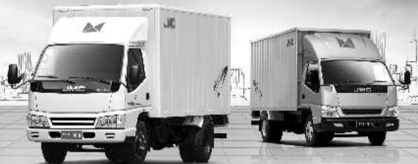
江铃·凯运 短轴后双轮

30年 专业轻卡品牌 100万 用户好评如潮 250万 公里平均寿命 最高省 7000 新春高端轻卡风云惠 江铃短轴高端轻卡普及价 7.28万起