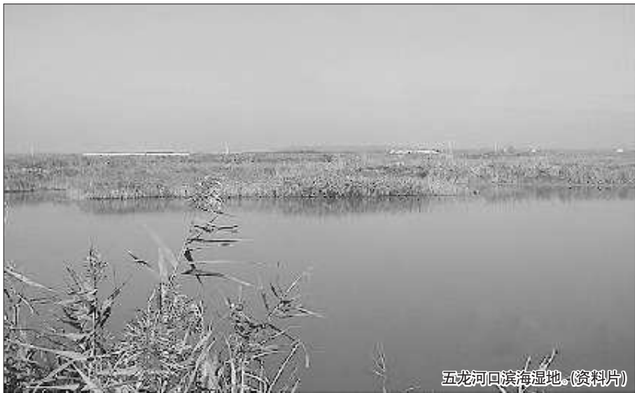
五龙河口滨海湿地。(资料片)

莱阳五龙河口湿地滨海保护区主要保护目标是,保护北方半岛地区独特的常年流水河口生态系统;保护常年流水河口附近特有的生物资源多样性;以及保护河口湿地。通过五