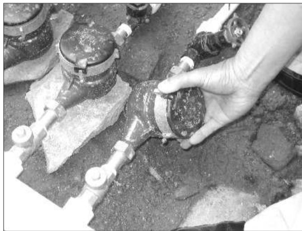
▲周庄小区,水表安装的有些松,一掰就动

根据枣庄市城市居民用水“一户一表,计量出户”改造实施细则第十二条的规定,户内施工方案及水管穿孔的位置,供水企业应预先征询用户意见,并尽可能满足用水户的要求。第十九条,城市居民用水户表改造工程,因施工原因导致道路、花坛、草坪、下水道等公共设施损坏的,由施工单位负责恢复,一律免交其他费用。