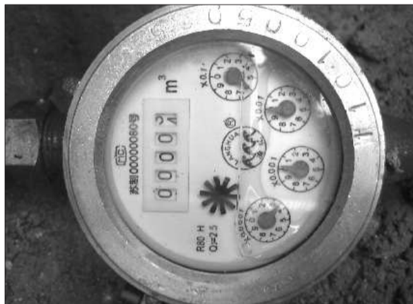
▲市中区马宅子孙先生家的水表箱内,水表中还有水