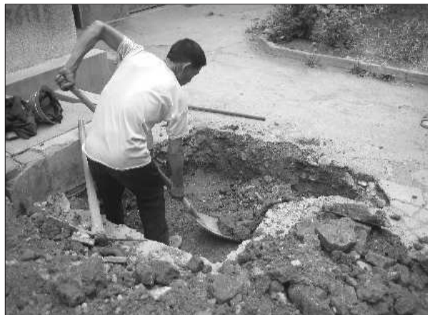
▲5月20日,施工队正在施工

根据枣庄市城市居民用水“一户一表,计量出户”改造实施细则第十五条规定,工程竣工后,供水企业先进行自检,主要包括用水户室外管道、户表和室内管道安装等,在自检无问题的基础上征求产权单位和用水户意见,并由产权单位代表及用水户代表在竣工验收单上签字认定,每季度末建设主管部门组织供水企业、施工单位、产权单位及用水户代表进行联合验收。对经验收不合格的工程,责令限期整改,对因不合格改造给用水户造成的损失,由施工单位负责赔偿。