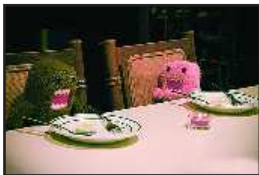
(夏天来了,我要减肥)