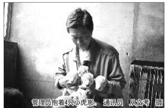
管理员抱着4只小虎崽。