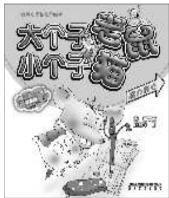
“大个子老鼠小个子猫”系列 周锐 著 春风文艺出版社 2011年5月出版

书中还有不少故事富有哲理、启迪心智。如《美貌相机》一篇,叙事一波三折,寥寥几百字就把大个子老鼠的聪慧、小猪的虚荣稚气以及其他小动物对新鲜事物的好奇写得活灵活现。小猪拿着进口的“美貌相机”,不管用它给谁照相,照出来的都是小猪自己的脸,这让小猪十分得意,因为美貌相机照出的是最美的相貌;可这样一来,谁也不稀罕这个相机了。故事真正要说的是“大家喜欢自己有自己的脸”,每个人都是独特的存在,谁也不能代替谁,任何人的独立性都是不能剥夺和取消的。这些故事深入浅出地讲了许多道理,但丝毫没有说教的痕迹;像盐溶在水中一样,道理溶在作者诗性的叙述里,哲理的引入让故事含义隽永,回味无穷。