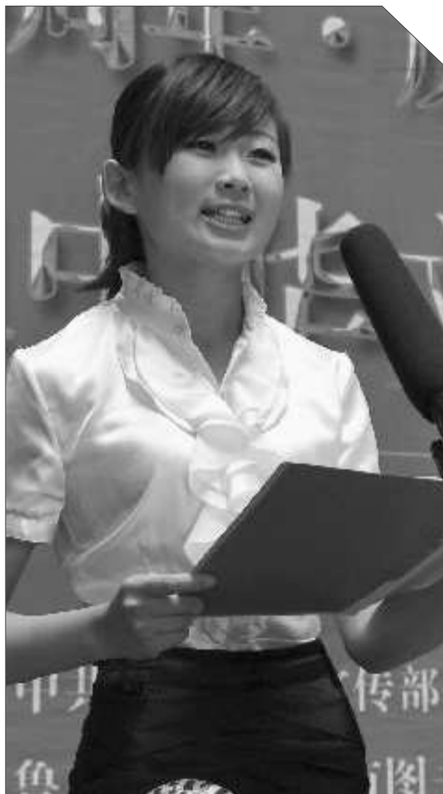
▲参赛者在台上朗诵。记者 展萍 摄

本次活动从启动以来就受到了社会各界的高度关注,作为“齐鲁文化特色新地标”的“万阅城”项目倾力支持该项赛事。万阅城作为中心地标、城市综合体,位于临沂人民广场正西,蕴含临沂市图书馆、地标写字楼、行政公寓、四星商务酒店、上新阶住宅、百丽广场、五星级星美影院等多元业态。