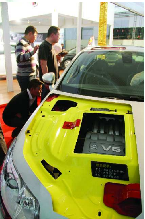
4月15日—17日,2011齐鲁春季第5届魅力临沂精品室内车展举办,3天展出时间吸引10万多市民观展,超过3000辆汽车被订购。