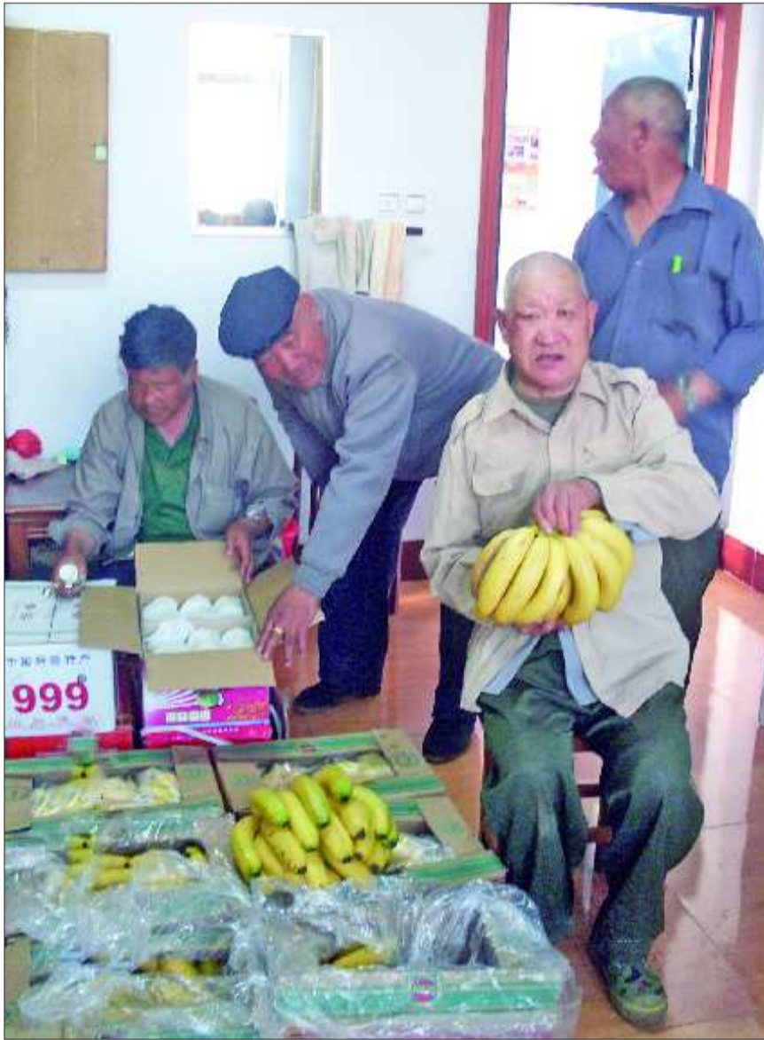
5月28日,在石臼敬老院内,老人们高兴地领取热心市民送来的新鲜水果。

据敬老院工作人员介绍,除了在节假日,到敬老院来送温暖献爱心的热心市民非常多之外,现在平时也变多了。包括企事业单位、普通市民、学生,有的给老人送营养品;有的是到敬老院来看老人们的生活环境或者活动设施,想为老人购置一些生活用品。