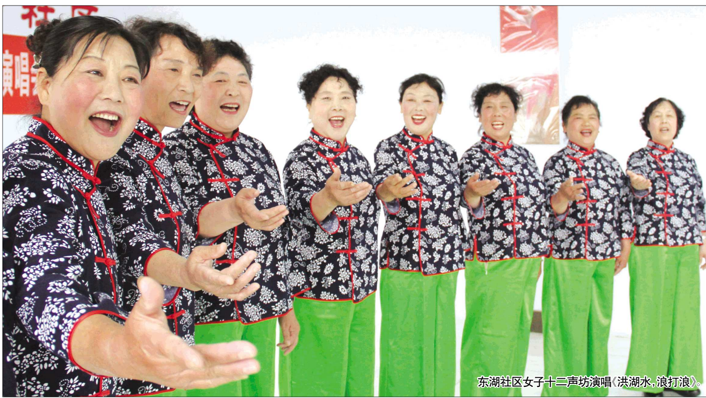
东湖社区女子十二声坊演唱《洪湖水,浪打浪》。