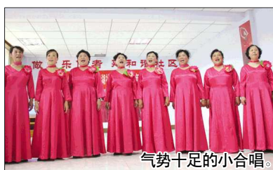
气势十足的小合唱。