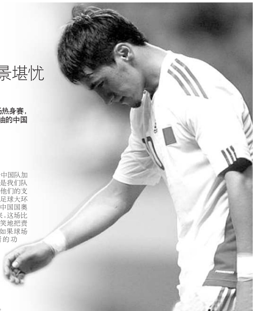
屡屡错失机会,巴力很郁闷。