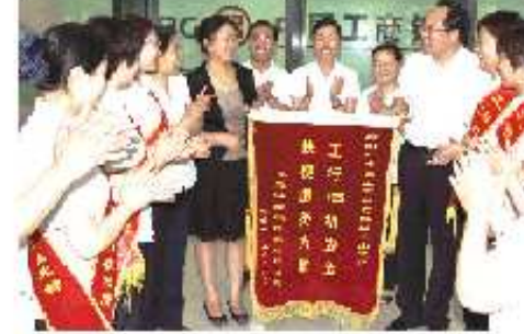
沂水县青少年活动中心剪彩仪式,多位领导出席。

沂水县青少年活动中心于近日正式启用。该中心将开展丰富多彩的青少年文体活动,为青少年提供健康的成长环境。