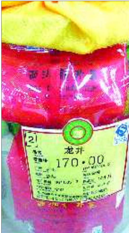
玻璃器皿标签上的生产日期是2011年5月12日,而里面茶叶包装袋上的日期是2010年12月18日。

按照国家食品法规定,茶叶属于食品类,一般保质期为一一年,保质期则是18个月。食品必须在包装上标明生产厂家、生产日期、保质期及包装地址等。