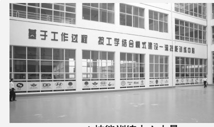
技能训练中心内景