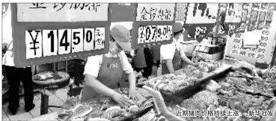
近期猪肉价格持续上涨。