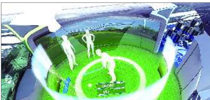
◀乘客可以打虚拟的高尔夫球。