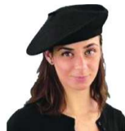
戴贝雷帽的女士兵。

本报讯 综合外国媒体6月13日报道,经过10年失败的尝试后,美国陆军决定弃用贝雷帽,重新使用带有鸭舌的巡逻帽。